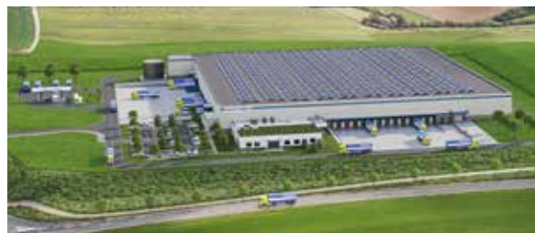
Distribuční centrum dílů Massbach

Nový design krabic a přechod na jednotné materiály usnadňuje a zefektivňuje recyklaci. Skvělým příkladem je balení čelních skel do kompletně kartonového obalu.