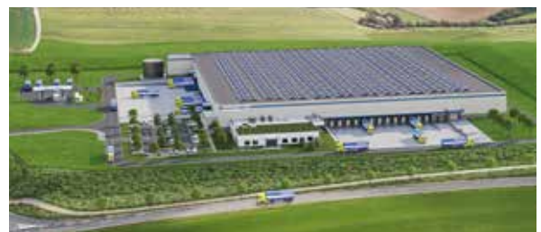
Distribučné stredisko pre diely Massbach

Prepracovanie škatúl a prechod na jeden materiál uľahčuje a zefektívňuje recykláciu. Skvelým príkladom je obal čelného skla, ktorý je kompletne z kartónu.